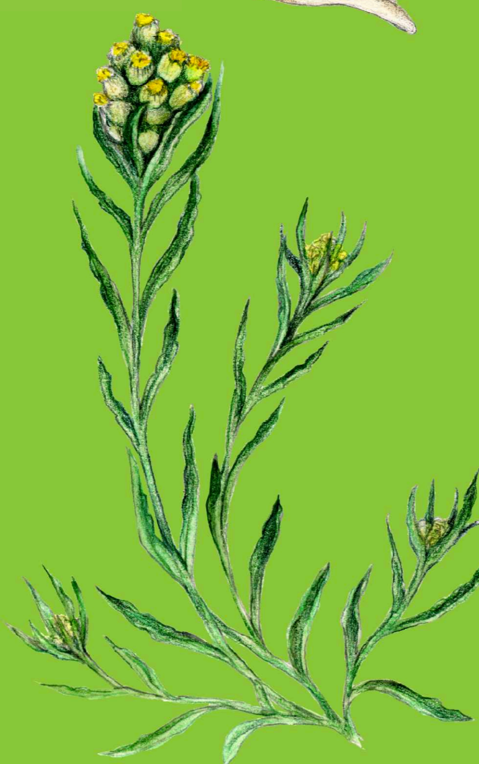
protěž žlutobílá Pseudognaphalium luteoalbum

Naše jediná žába, která má za denního světla zorničku oka orientovanou vzhůru. Po většinu roku je aktivní za soumraku a v noci, den tráví zahrabaná v zemi.