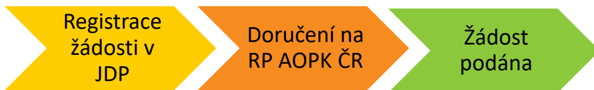
Obrázek č. 1: Kroky vedoucí k podání žádosti

Ekonomické přílohy ve formátu ZIP, rozpočet, naskenovanou úvodní stranu projektové dokumentace a Soupis všech příloh je nutné do JDP nahrát vždy. Ostatní přílohy, které není možné z kapacitních důvodů nahrát přímo do JDP, doručte na AOPK ČR stanoveným způsobem.