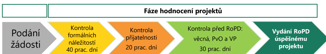
Obrázek č. 3: Schéma hodnocení projektů s orientační dobou hodnocení

Každý měsíc je pak stanoven Harmonogram administrace žádostí, přičemž lhůta pro vyhodnocení těchto žádostí je orientačně 90 pracovních dní.